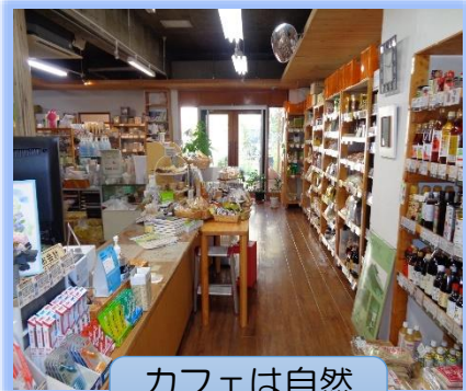
落ち着いた雰囲気の内