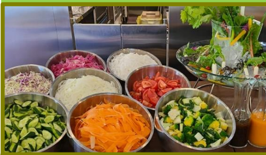
野菜たっぷりのビュッフェ

愛犬と一緒に食事が楽しめるテラス席もあり、自然豊かな小幡緑地の開放感あふれる空間で美味しいお料理を楽しめます。