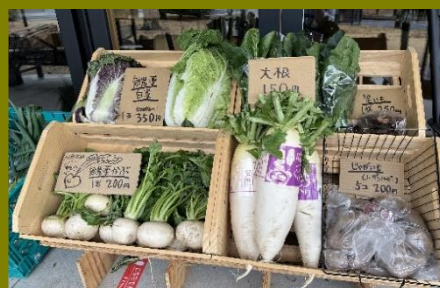
店頭で野菜を販売