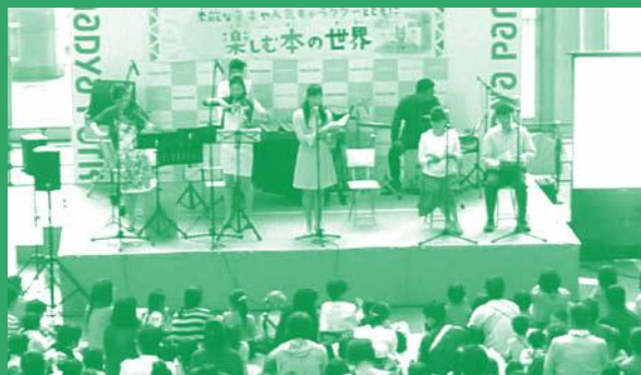
平成29年度なごやっ子読書イベントの様子